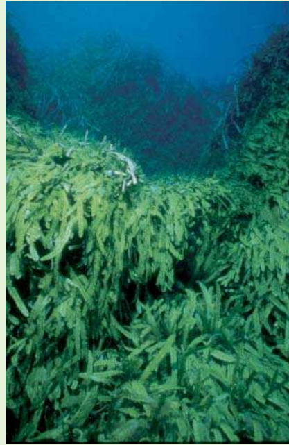
Infestación de Caulerpa

La Caulerpa fue introducida en el Mediterráneo sobre 1984, posiblemente con desechos procedentes del acuario de Mónaco. Se especula sobre si la especie liberada en el Mediterráneo era un clon más resistente del alga tropical original. Se adaptó bien a las aguas más frías y se expandió a través del Mediterráneo septentrional donde es una seria amenaza para la flora y fauna marina nativa. Es capaz de formar nuevas colonias a partir de pequeños fragmentos de la planta y, siendo un autostopista oportunista, es una amenaza para todo el Mediterráneo. Donde se ha establecido por sí misma, ha ahogado hábitat como las praderas marinas nativas donde crían numerosas especies. El 12 de Junio de 2000, en una laguna cerca de San Diego en los Estados Unidos, unos buceadores descubrieron un parche de Caulerpa que media unos 20x10 metros. También en este caso se pensó que la infestación debió ocurrir después de que alguien vaciase un acuario dentro de un desagüe. Afortunadamente esta invasión fue descubierta en un estadio temprano y se tomaron medidas para erradicarla.